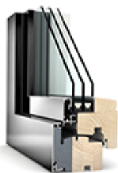
Nízkoenergetická okna VEKRA s titanovým kováním, mikroventilací a 5-ti komorovým profilem