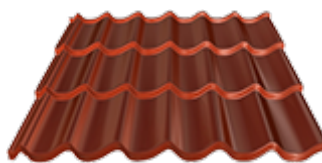
Zateplení krovu 30 cm kvalitního izolantu a uložení pravé pálené střešní krytiny TONDACH